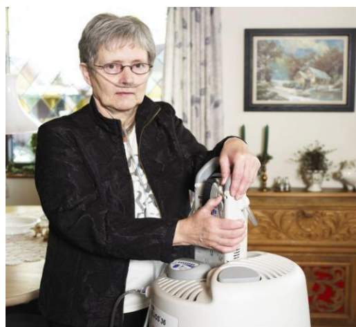
Figur 3 - Påfyldning af lille enhed med flydende ilt

Flydende iltbehandling består af en stor stationær beholder som indeholder flydende ilt (minus 183 °C) til 1-4 ugers forbrug. Fra den store stationære beholder kan man efter behov tappe flydende ilt til en bærbar beholder. Beholderne vejer fra 1,6-3,5 kg og rummer ilt til 3-11 timer ved flow på 1,5 l/minut. Generelt anvendes flydende ilt til de mest mobile patienter. Dog kan enkelte patienter ikke håndtere systemet, og hvis patienten bor i en etageejendom uden elevator, kan det være besværligt at levere de ca. 50 kg tunge stationære beholdere.