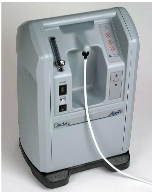
Figur 1 - Iltkoncentrator

Koncentratorerne udsender en jævn summen med en lydstyrke på 40-55 dB. Udgiften fra strømforbruget til koncentratoren refunderes fra det offentlige.