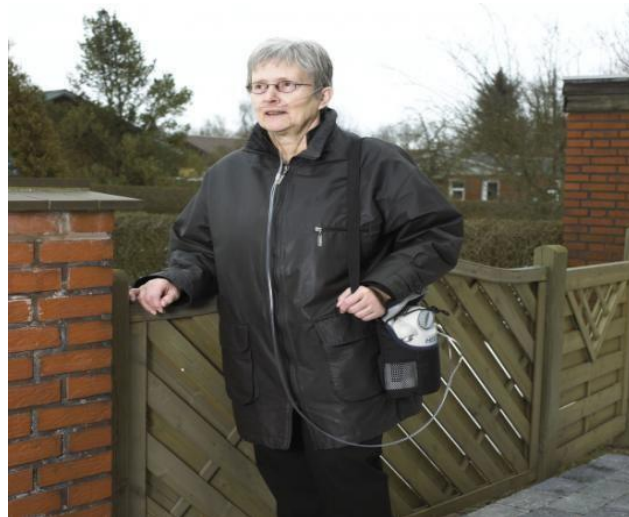
Figur 2 - Flydende ilt via bærbar enhed

Komprimeret ilt på letvægtsflasker er den mest udbredte form for bærbar ilt i Danmark. Ilflaskerne leveres i forskellige størrelser fra iltleverandøren. En 2-liters flaske med ca. 380 liter ilt vejer inklusivreduktionsventil ca. 3 kg og rækker til 6 timer med flow på 1 l/min. For de fleste patienter er denne vægt det maksimale af hvad de selv kan bære. De bærbare flasker kan enten bæres i en skuldertaske,